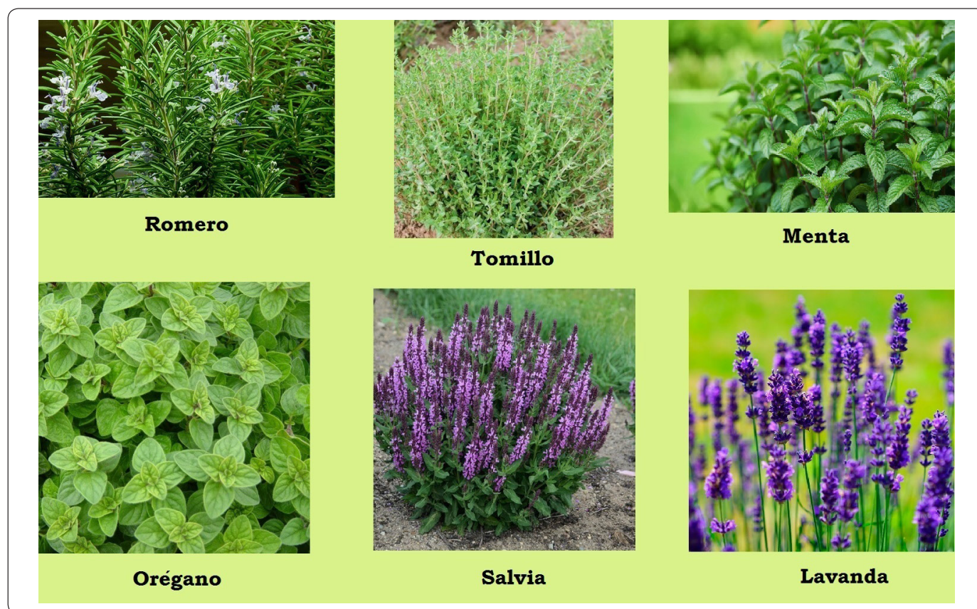
Figura 1. Ejemplos de algunas plantas pertenecientes a la familia Lamiaceae. NOTA: Fotografías tomadas de internet cuyas direcciones son las siguientes: Romero: https://bit.ly/312Z7MD . Página “ASAJA-JAÉN” organización profesional agraria. Tomillo: https://bit.ly/3fbHqja . Página de la comunidad “FLICKR” por Rafael de Jesús. Menta: https://bit.ly/2CTtWeR . Página del blog “Comer con conciencia: Alimento” por Verónica Mollejo. Orégano: https://bit.ly/2P6KwKH . Página del blog de ciencia “Bajo el microscopio” por Miguel Verde. Salvia: https://bit.ly/3jOLJ7o . Página de venta de plantas y accesorios de jardín “Beechmount Garden Centre”. Lavanda: https://bit.ly/2DkAzXr . Página de venta de semillas “Entre Semillas”.

demonstrando sus propiedades insecticidas, en el control de plagas (Fotso et al. , 2019).